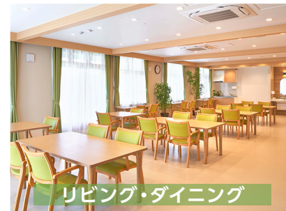
リビング・ダイニング