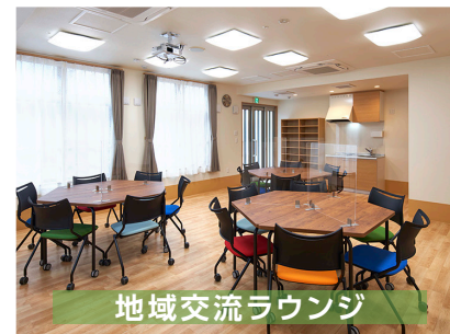
地域交流ラウンジ